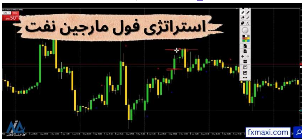
استراتژی فول مارجین نفت