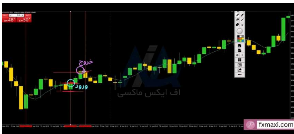
استراتژی فول مارجین نفت - خرید