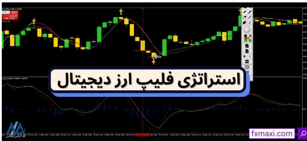
استراتژی فلیپ ارز دیجیتال