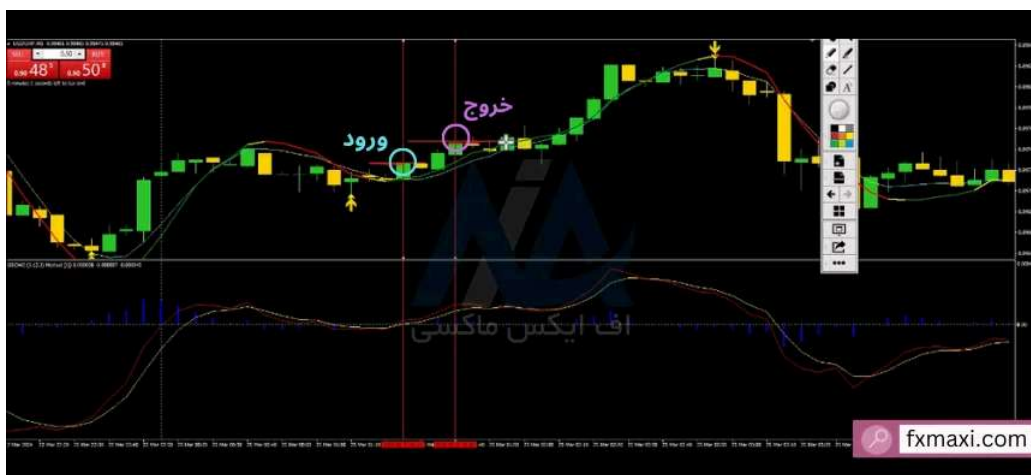
استراتژی فلیپ ارز دیجیتال - خرید