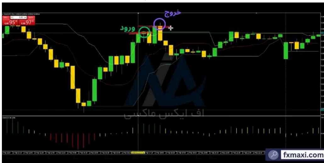
بهترین استراتژی مارتینگل در فارکس - خرید