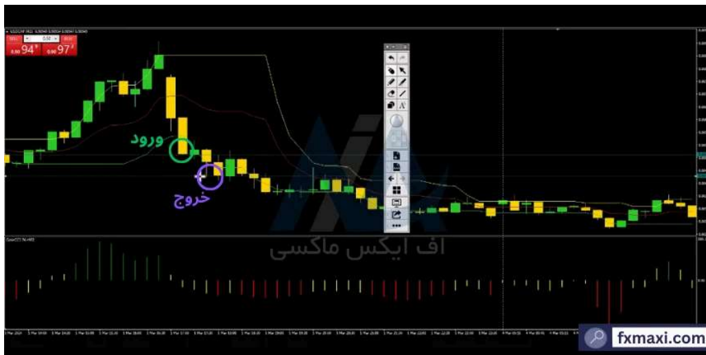
بهترین استراتژی مارتینگل در فارکس - فروش