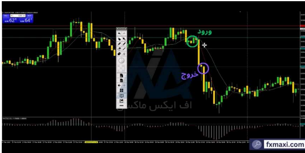
استراتژی بر اساس حجم ترید طلا - فروش