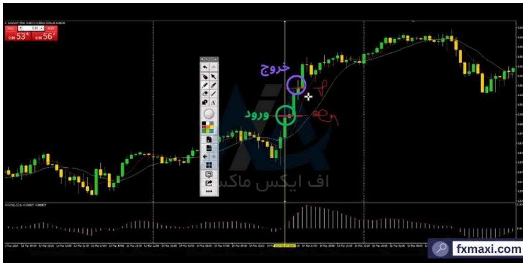
استراتژی بر اساس حجم ترید طلا - خرید