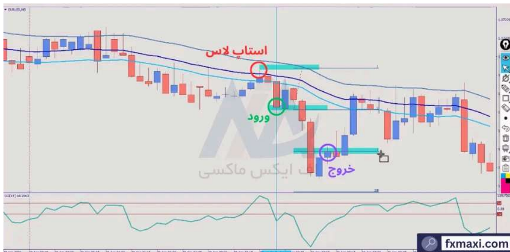
استراتژی صد درصد طلا - فروش