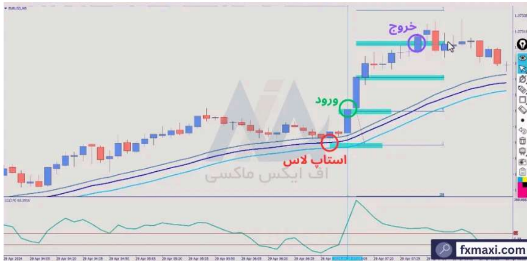
استراتژی صد درصد طلا - خرید