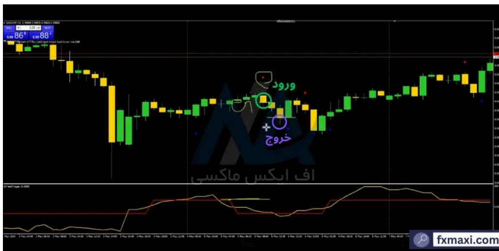
استراتژی ترید با واگرایی - فروش

نقطه ورود شما در این حالت، بسته شدن کندل بعد از کندل بولد داون است. حد سود (TP) را 5 پیپ، پایین تر از نقطه ورود و حد ضرر (SL) را کمی بالاتر از نقطه ورود؛ قرار دهید.