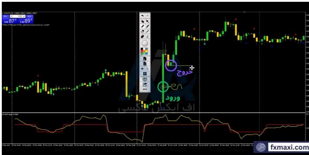
استراتژی ترید با واگرایی - خرید