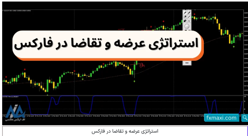
استراتژی عرضه و تقاضا در فارکس

در این استراتژی، از اندیکاتورهای میانگین متحرک و استوکاستیک، جهت دریافت سیگنال طلا ، استفاده می شود. سیگنال های دقیق خرید و فروش طلا در نمودار 4 ساعته ، با این اندیکاتورها، در دسترس است.