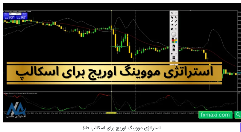
استراتژی مووینگ اوریج برای اسکالپ طلا

سیگنال طلا در این استراتژی، با نرخ برد بالا و بر پایه اندیکاتورهای X2 Pips و اسپلاتور استوکاستیک، بنا شده است: که با استفاده از آن می‌توانید در معاملات خود به سود برسید.