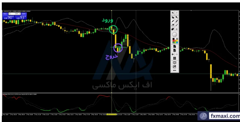
استراتژی مووینگ اوریج برای اسکالپ طلا - فروش