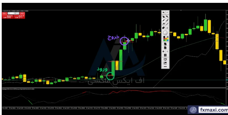
استراتژی مووینگ اوریج برای اسکالپ طلا - خرید

در تصویر زیر، مثالی از استفاده از این استراتژی برای خرید را مشاهده می‌کنید: