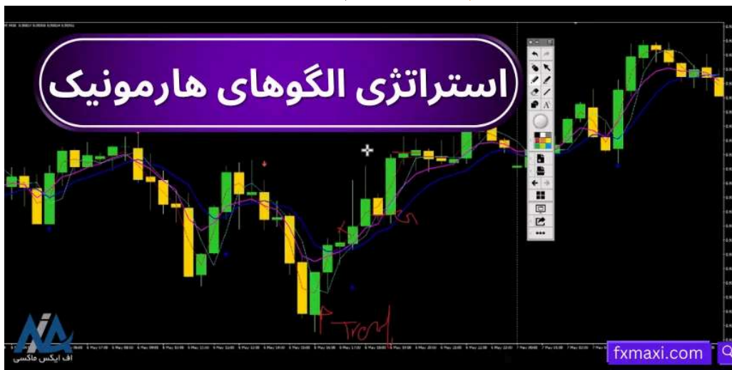
استراتژی الگوهای هارمونیک