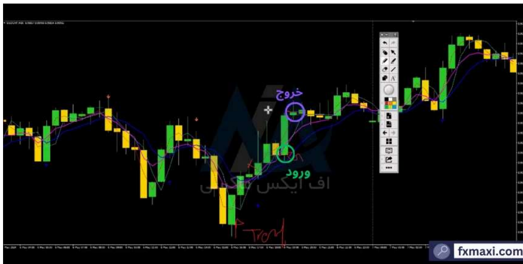
استراتژی الگوهای هارمونیک - خرید