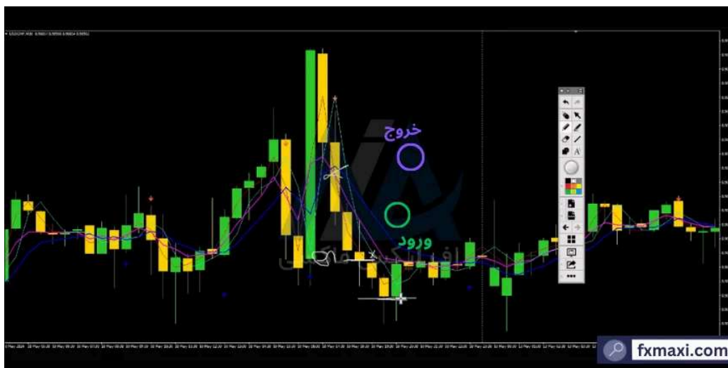
استراتژی الگوهای هارمونیک - فروش

در تصویر زیر، مثالی از استفاده از این استراتژی را مشاهده می‌کنید: