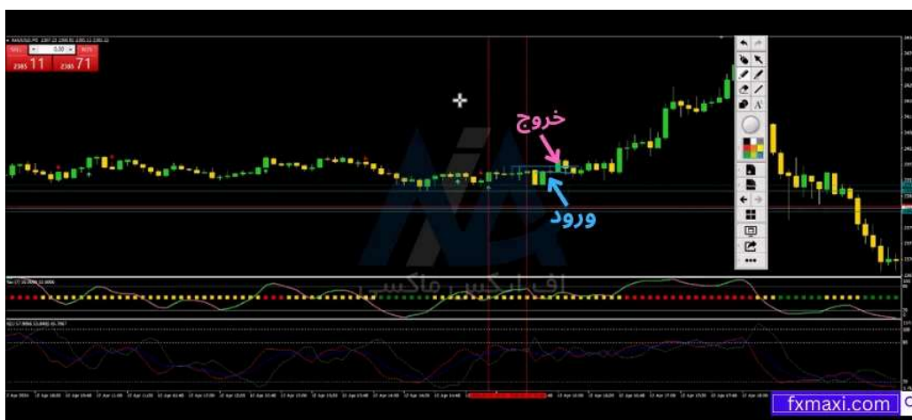
استراتژی مخصوص طلا در فارکس - خرید