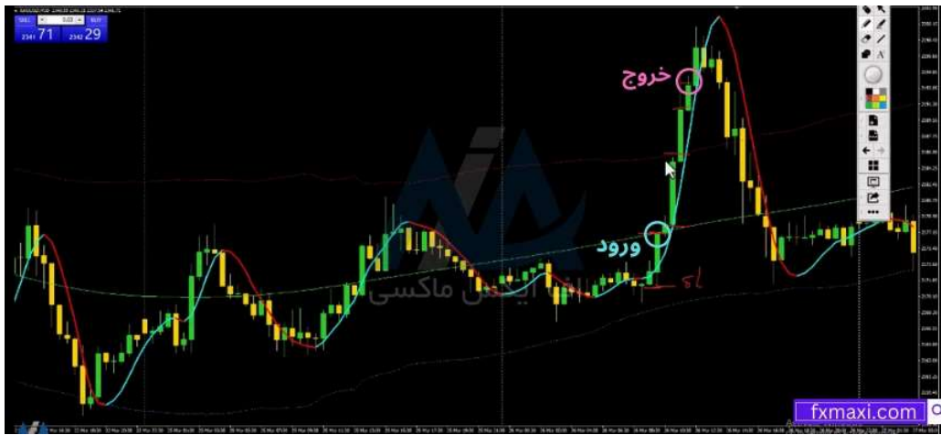
استراتژی کانال رگرسیون - خرید