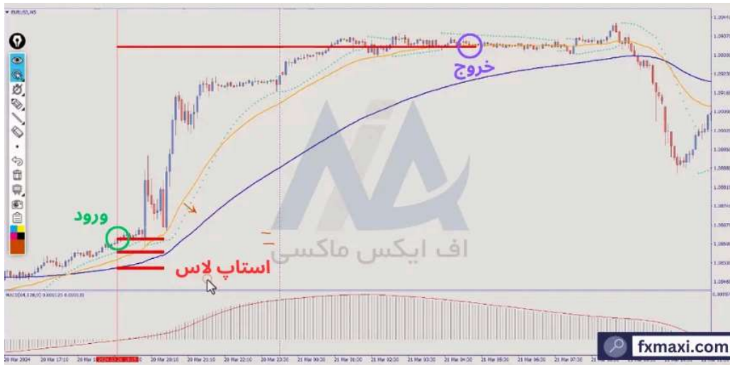
استراتژی معاملاتی پین بار پرایس اکشن - خرید