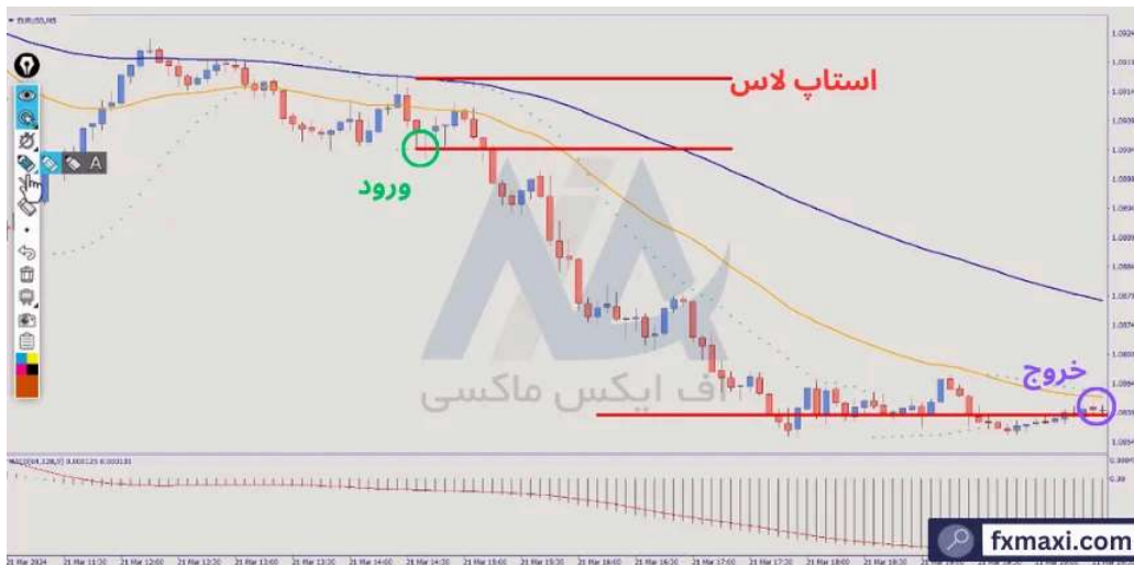
استراتژی معاملاتی پین بار پرایس اکشن - فروش