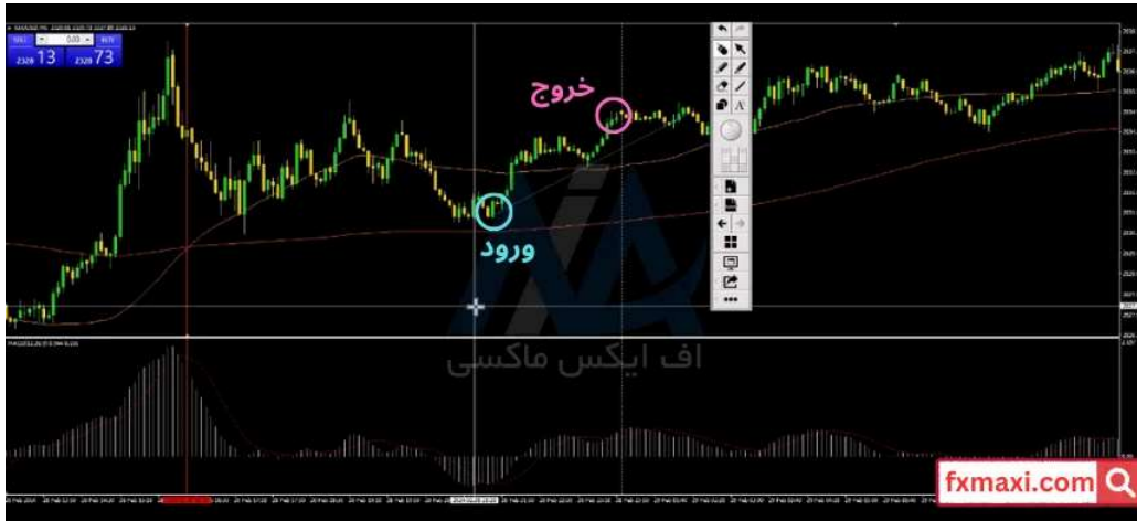
استراتژی فیوچرز 5 دقیقه ای - خرید