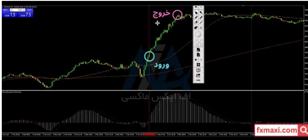
استراتژی فیوچرز 5 دقیقه ای - خرید

در تصویر زیر، مثالی از استفاده از این استراتژی را مشاهده می کنید: