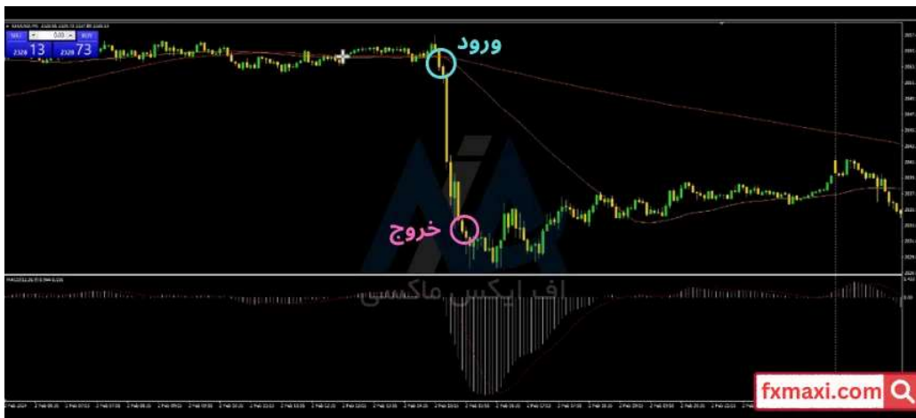
استراتژی فیوچرز 5 دقیقه ای - فروش