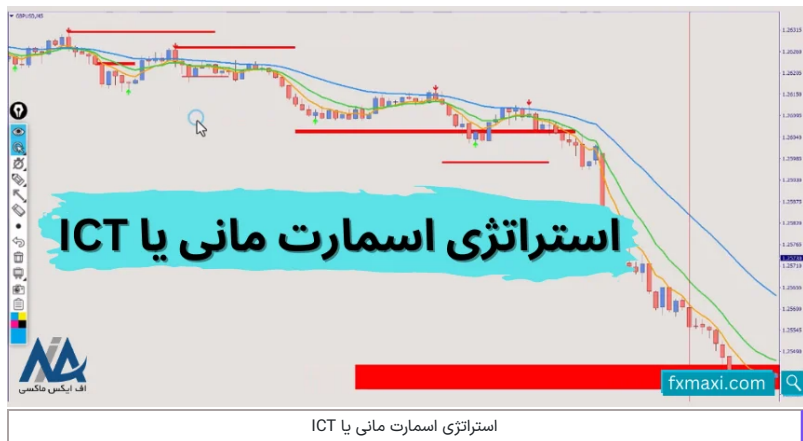
استراتژی اسمارت مانی یا ICT

سیگنال کریپتو در این استراتژی، با کمک اندیکاتورهای میانگین متحرک و فراکتال، به دست می آید. بهترین نتایج این استراتژی، برای کوین های با مارکت کپ خوب و در [تایم فریم 5 دقیقه]، به ثبت رسیده است.