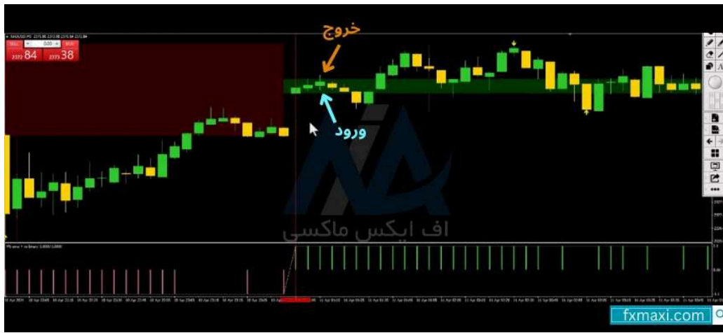
استراتژی سه کندلی - خرید