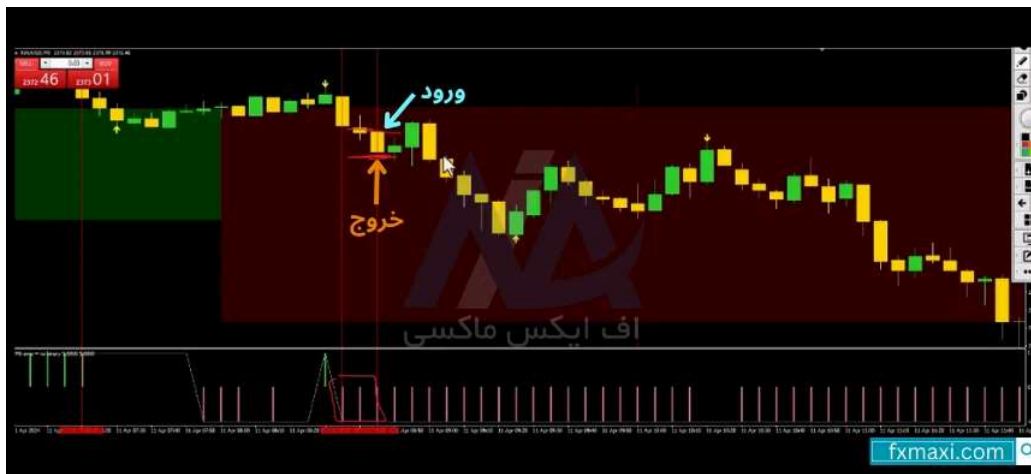
استراتژی سه کندلی - فروش