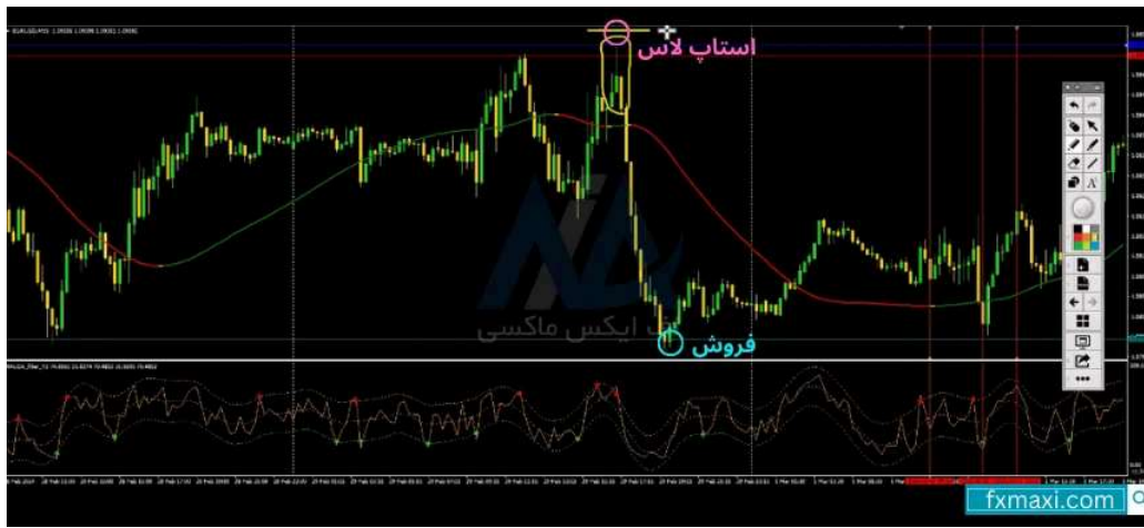
استراتژی با وین ریت 100 – فروش