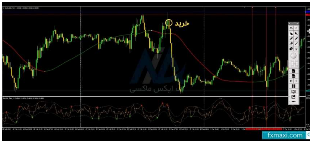
استراتژی با وین ریت 100 - خرید