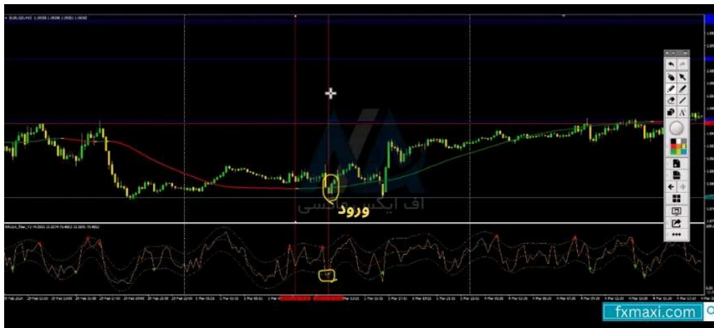
استراتژی با وین ریت 100 - خرید