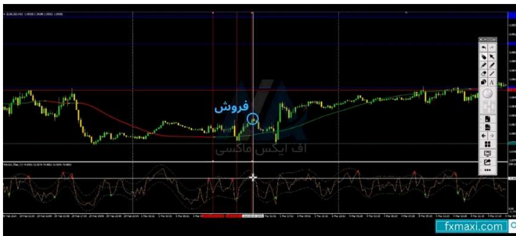
استراتژی با وین ریت 100 - فروش