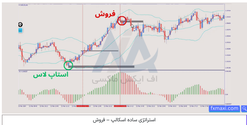
استراتژی ساده اسکالپ - فروش