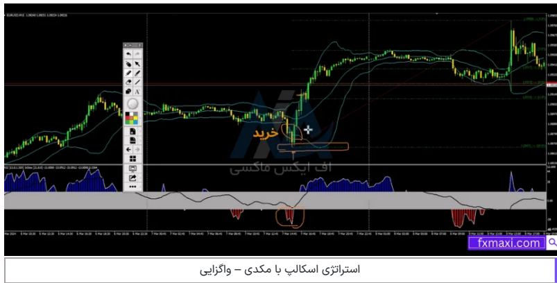
استراتژی اسکالپ با مکدی - واگرایی