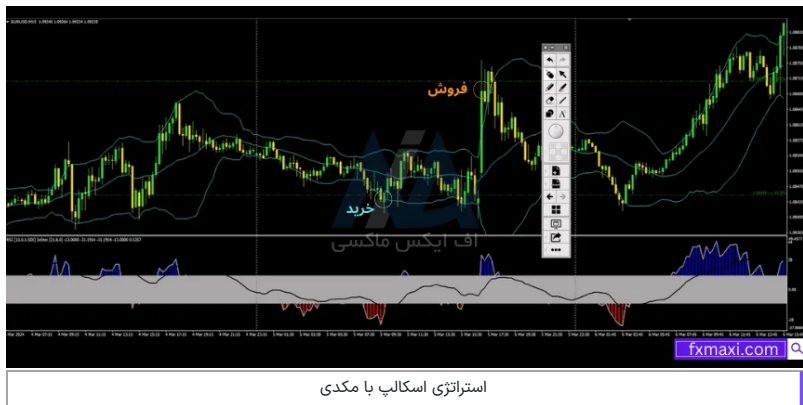
استراتژی اسکالپ با مکدی

در تصویر زیر، مثالی از استفاده از این استراتژی را مشاهده می کنید: