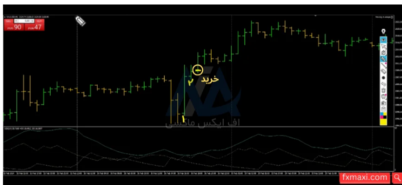
استراتژی تایم فریم یک ساعته - خرید