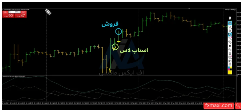
استراتژی تایم فریم یک ساعته - فروش