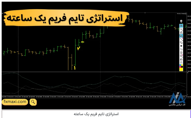
استراتژی تایم فریم یک ساعته

این استراتژی که به عنوان استراتژی اسکالپ فارکس نیز، شناخته می شود، برای معامله گران در سطوح مختلف، از مبتدی تا پیشرفته، مناسب بوده و می تواند به شما در کسب سود در بازارهای مالی کمک کند.