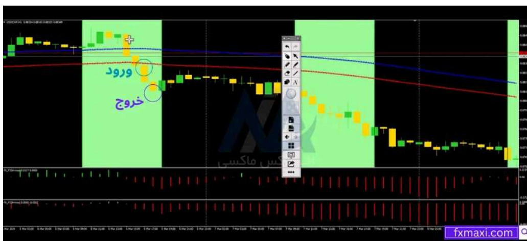
استراتژی بریک اوت لندن - فروش