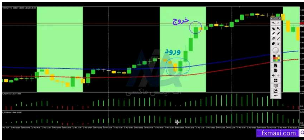
استراتژی بریک اوت لندن - خرید