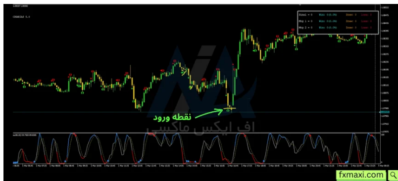
استراتژی باینری آپشن با موفقیت 90% - پیدا کردن نقطه ورود