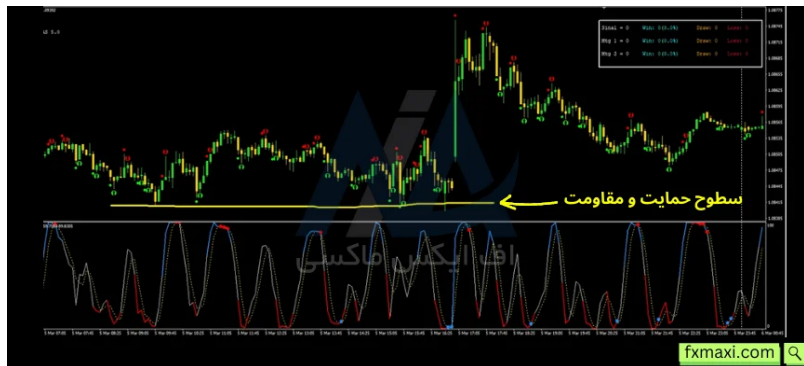
استراتژی باینری آپشن - پیدا کردن سطوح حمایت و مقاومت

برای مثال، در تایم فریم یک دقیقه یورو/دولار آمریکا، سطوح حمایت و مقاومت را پیدا می‌کنید.