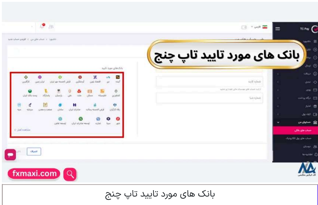
بانک های مورد تایید تاپ چنج