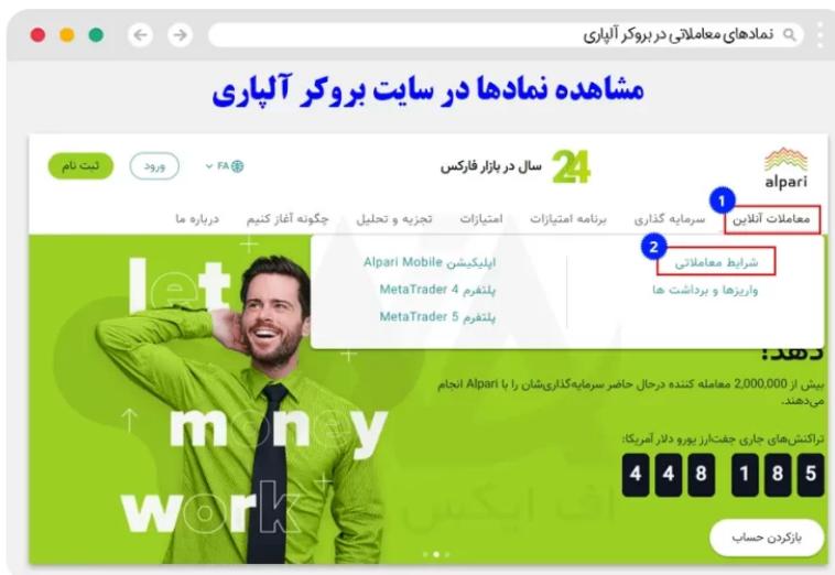
نحوه مشاهده نمادهای بروکر آلپاری در سایت رسمی

کاربران در ابتدا باید وارد سایت بروکر شده، و همانند تصویر از سربرگ "معاملات آنلاین" وارد بخش شرایط معاملاتی شوند.