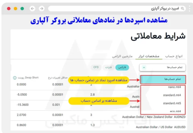
نحوه مشاهده اسپردهای آلپاری - قدم 2

در این قسمت کاربر در ابتدا، باید حساب حقیقی مورد نظر را انتخاب نماید. البته کاربران می‌توانند بدون انتخاب حسابی، میزان اسپرد نماد را در تمامی حساب‌های معاملاتی مشاهده کرده، و به راحتی با یکدیگر مقایسه نمایند.