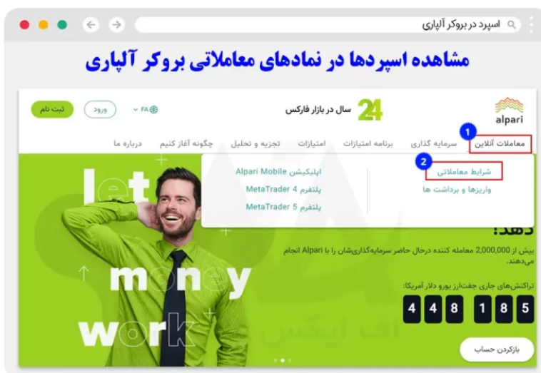
نحوه مشاهده اسپردهای آلپاری - قدم 1

کاربران در ابتدا باید وارد وب سایت alpari شده؛ و در ادامه مطابق تصویر زیر؛ از سربرگ معاملات آنلاین، بر روی گزینه "شرایط معاملاتی" کلیک کنند.