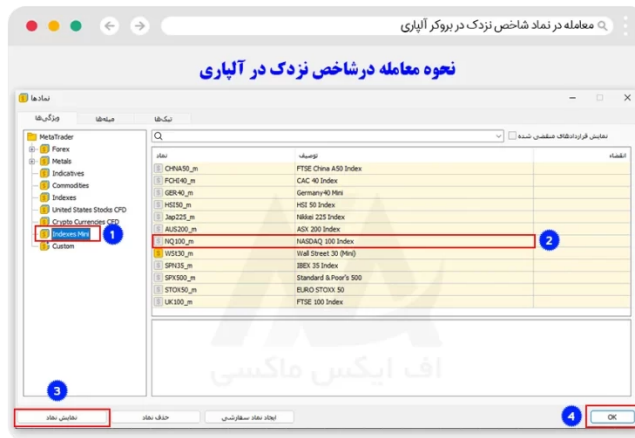
نحوه معامله نماد نزدک در متاتریدر ویندوز