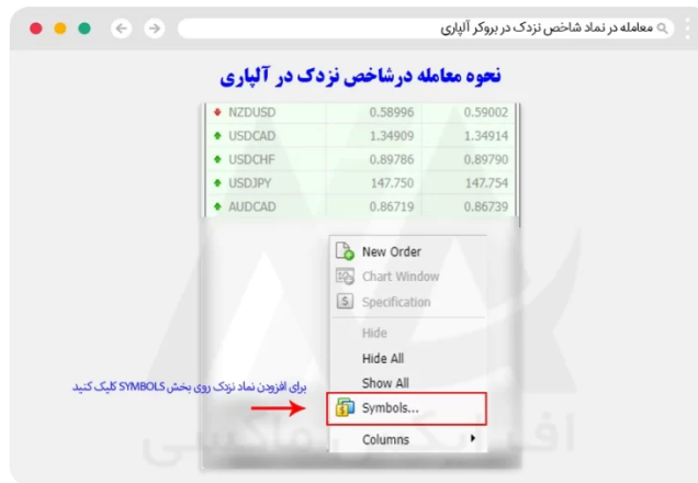
نحوه معامله نماد نزدک در متاتریدر تحت وب

در این قسمت، کاربر باید در بخش واچ لیست، رایب کلیک کرده و در منوی باز شده، بر روی گزینه symbols کلیک نماید.