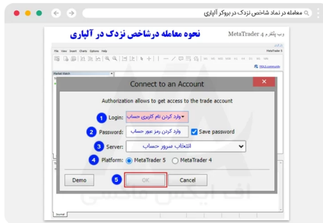
نحوه معامله نماد نزدک در متاتریدر تحت وب