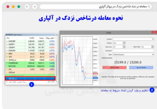
نحوه معامله نماد نزدک در متاتریدر ویندوز

در مرحله آخر، کاربر از بخش نمادها، نماد نزدک را انتخاب کرده و با کلیک بر روی آن، پنجره مربوط به سفارش کاربر باز شده که، معامله گر باید اعداد مربوط به آن را وارد کرده و معامله را باز کند.