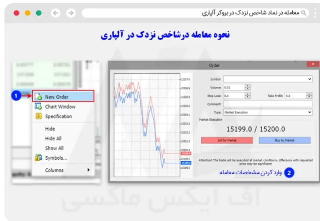
نحوه معامله نماد نزدک در متاتریدر تحت وب