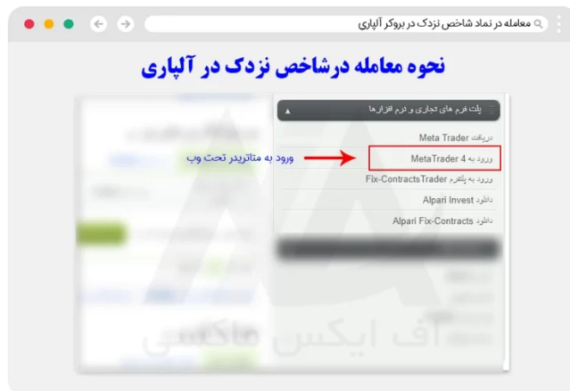
نحوه معامله نماد نزدک در متاتریدر تحت وب

مطابق تصویر زیر، کاربران باید بر روی گزینه "ورود به metatrader 4" کلیک کرده تا، وارد محیط متاتریدر 4 تحت وب شوند.