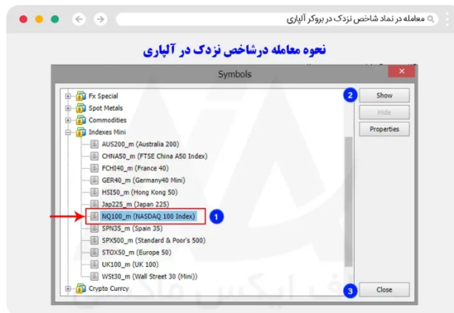
نحوه معامله نماد نزدک در متاتریدر تحت وب

در این قسمت، مطابق تصویر از بخش بازار شاخص ها (indexes-mini)، نماد NQ100-m را انتخاب کرده و، بر روی دکمه "show" کلیک کنید.