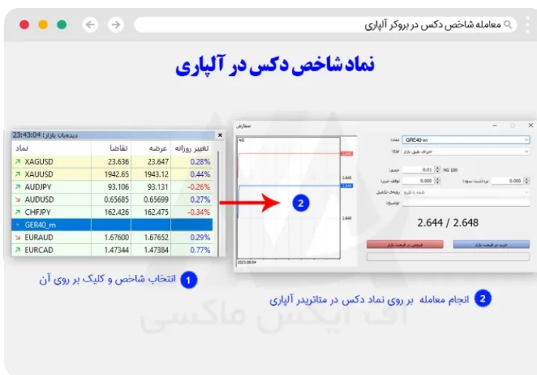
آموزش معامله نماد دکس در متاتریدر آپاری - باز کردن پوزیشن در نماد دکس

با کلیک بر روی این نماد از بخش واچ لیست، در پنجره معاملاتی باز شده، با تعیین مقادیر مورد نظر، می توانید پوزیشن خود را باز کنید.