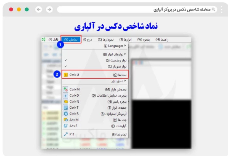
آموزش معامله نماد دکس در متاتریدر الپاری - نمایش نمادهای معاملاتی

کاربران مطابق تصویر زیر باید مشاهده نمادها و دارایی های معاملاتی الپاری، بر روی گزینه نمادها کلیک کنند.