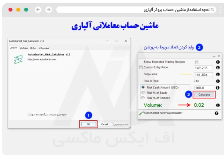
نحوه استفاده از ماشین حساب اتوچارتیست در بروکر آپاری - گام سوم

در این بخش در ابتدا، در پنجره باز شده بر روی گزینه "ok" کلیک کرده، تا پنجره مربوط به محاسبه میزان ریسک باز شود. سپس در پنجره باز شده، بعد از وارد کردن اعداد مربوط به استاپ لاس، قیمت ورود، بر روی گزینه "calculate" کلیک نمایید تا، جواب بدست آمده توسط ماشین حساب برای کاربر نمایش داده شود.