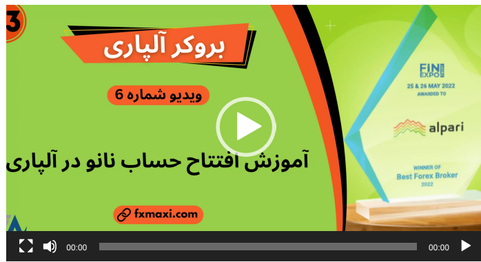
افتتاح حساب نانو در آلپاری