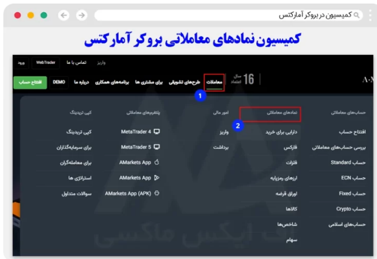
نحوه مشاهده کمیسیون آمارکتس

در ابتدا کاربران باید وارد وب سایت آمارکتس شده، و مطابق تصویر زیر، از سر برگ معاملات، بر روی گزینه "نماد معاملاتی" کلیک کنند.