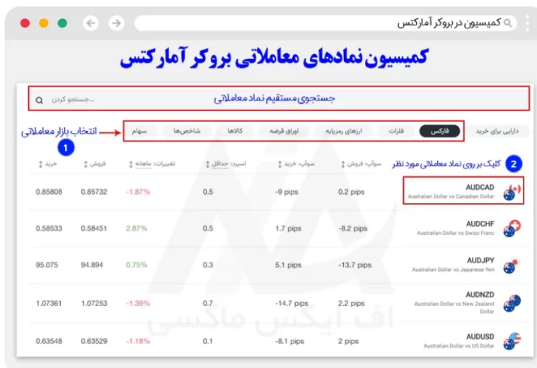
نحوه مشاهده کمیسیون آمارکتس

در این بخش کاربران می توانند به صورت مستقیم در بخش جستجو، نماد مورد نظر را سرچ کرده و یا، با انتخاب بازار معاملاتی، دارایی مورد نظر در آن بازار را انتخاب کرده و بر روی آن کلیک نمایند.